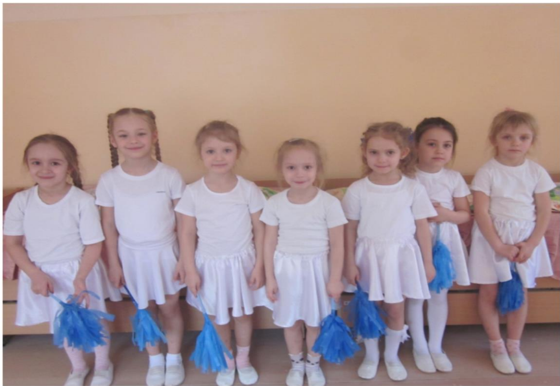
Подготовка артистов к спектаклю.