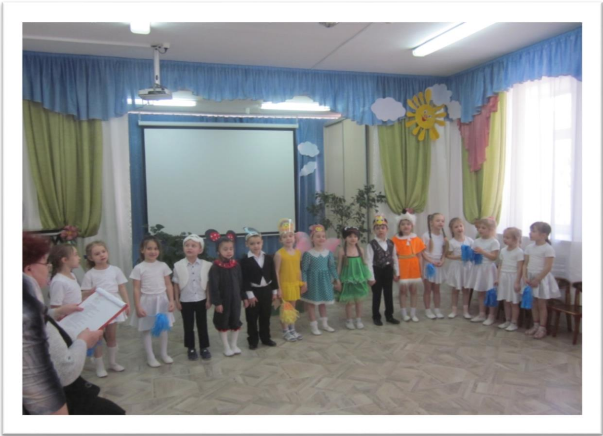
песня "Про дружбу".