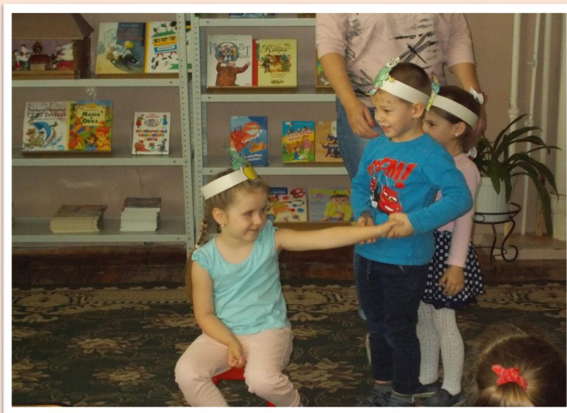
Сказка «Репка» - образец дружной семьи.