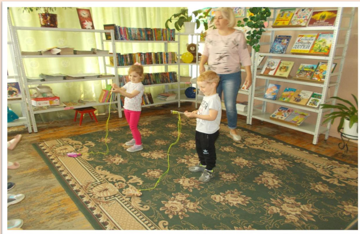
Игра «Кто быстрее поймает рыбку»- ах, как старались дети.