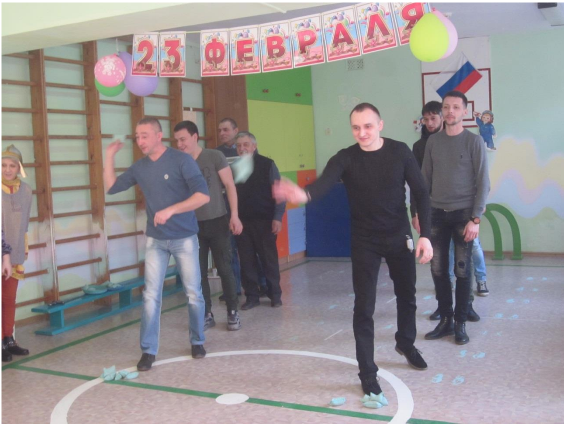
Папы попадают в цель.