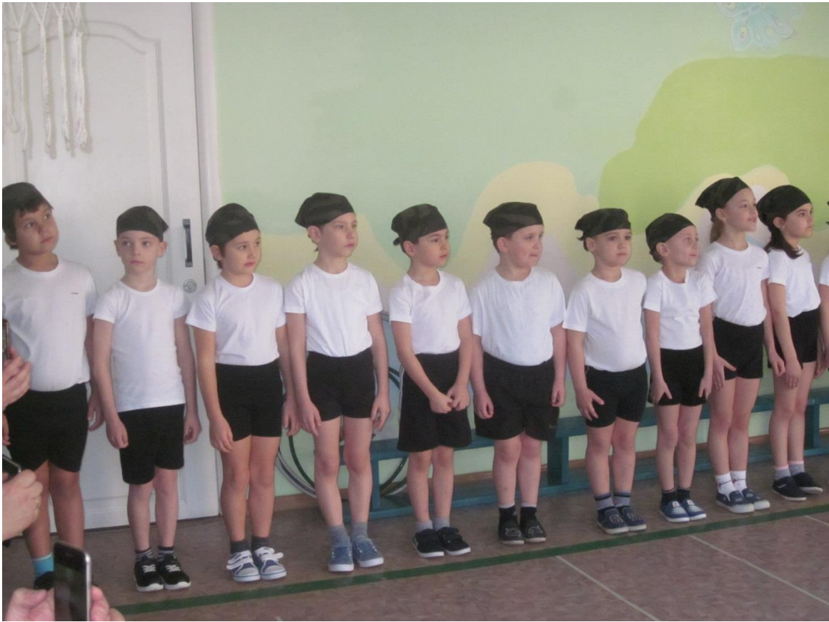
К соревнованиям готовы.