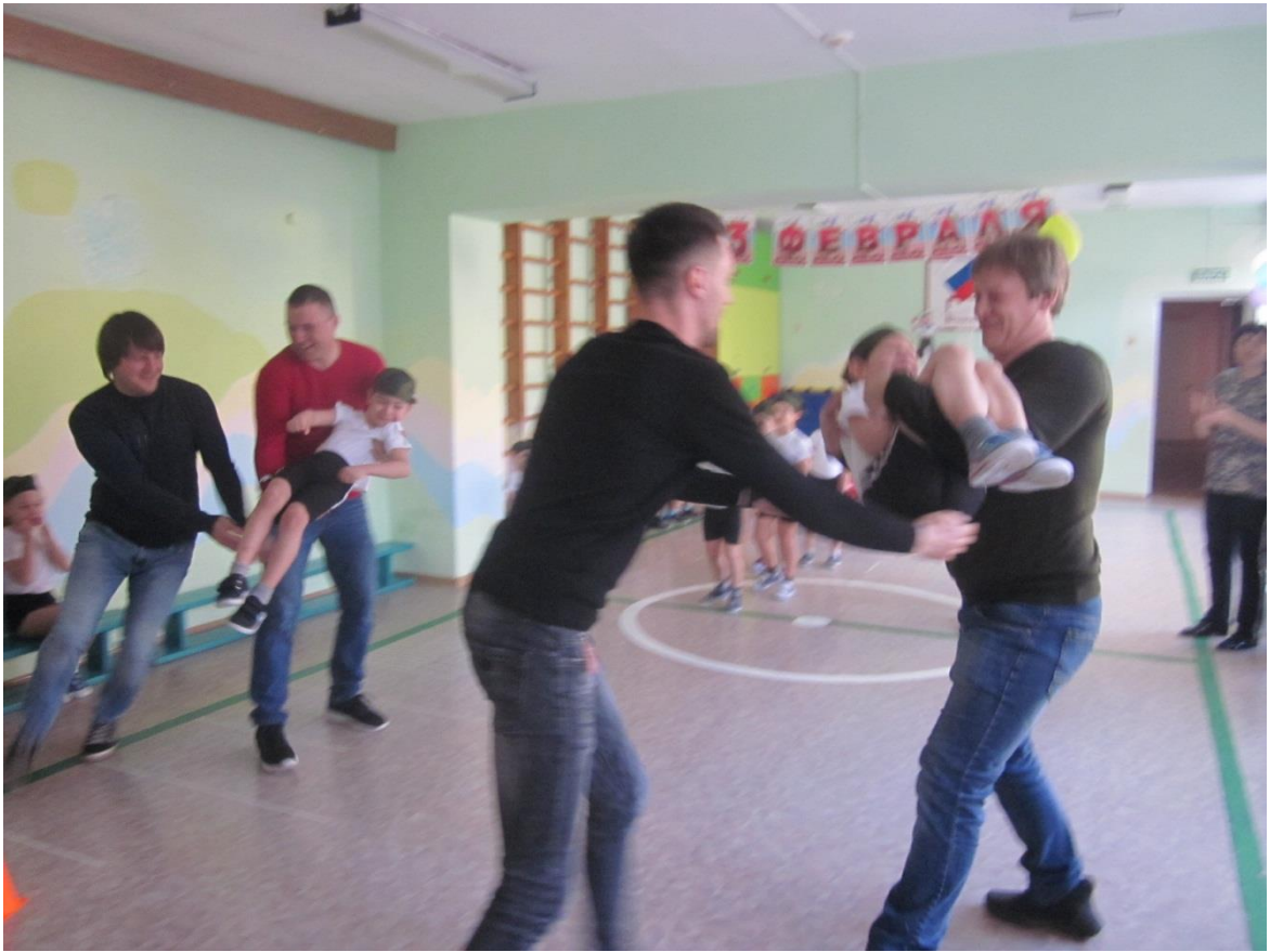
Эстафета «Перевези бойца»