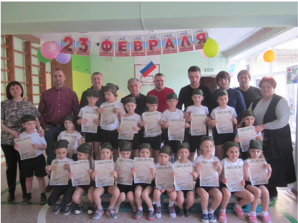
Фотография на память.