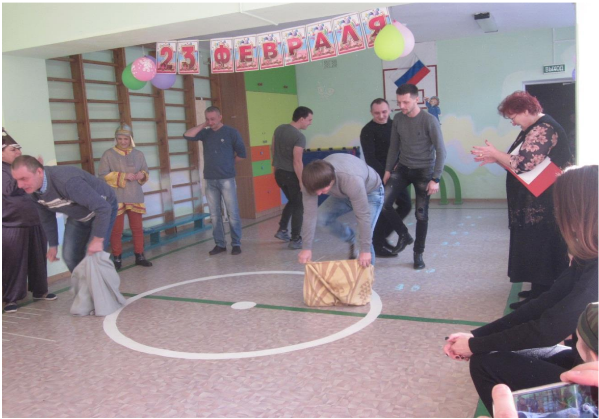
Папы соревнуются «Бег в мешках»