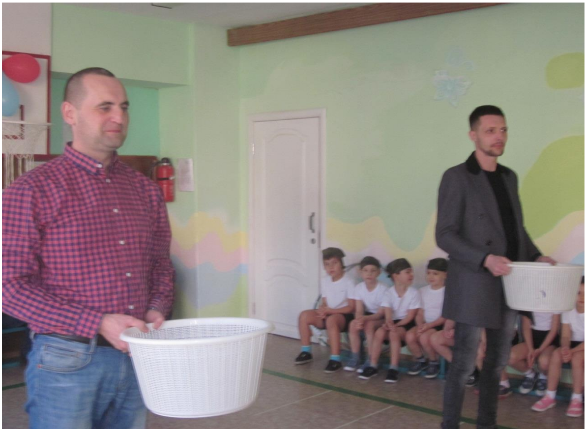
Эстафета «Чей самолет улетит дальше»