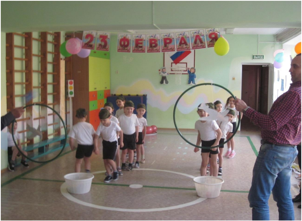
Эстафета «Артиллеристы» (сбей самолет)