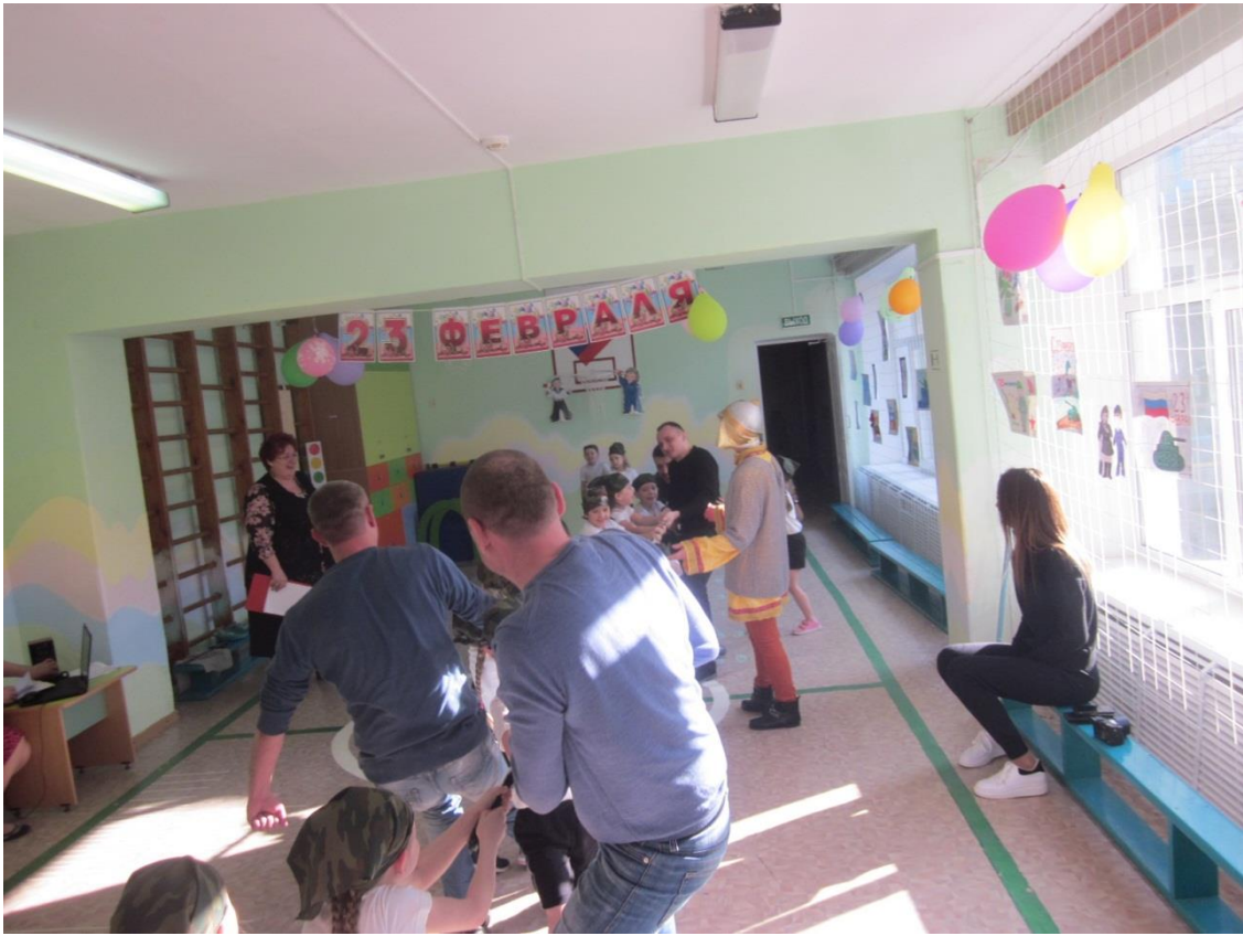
« Перетяни канат »