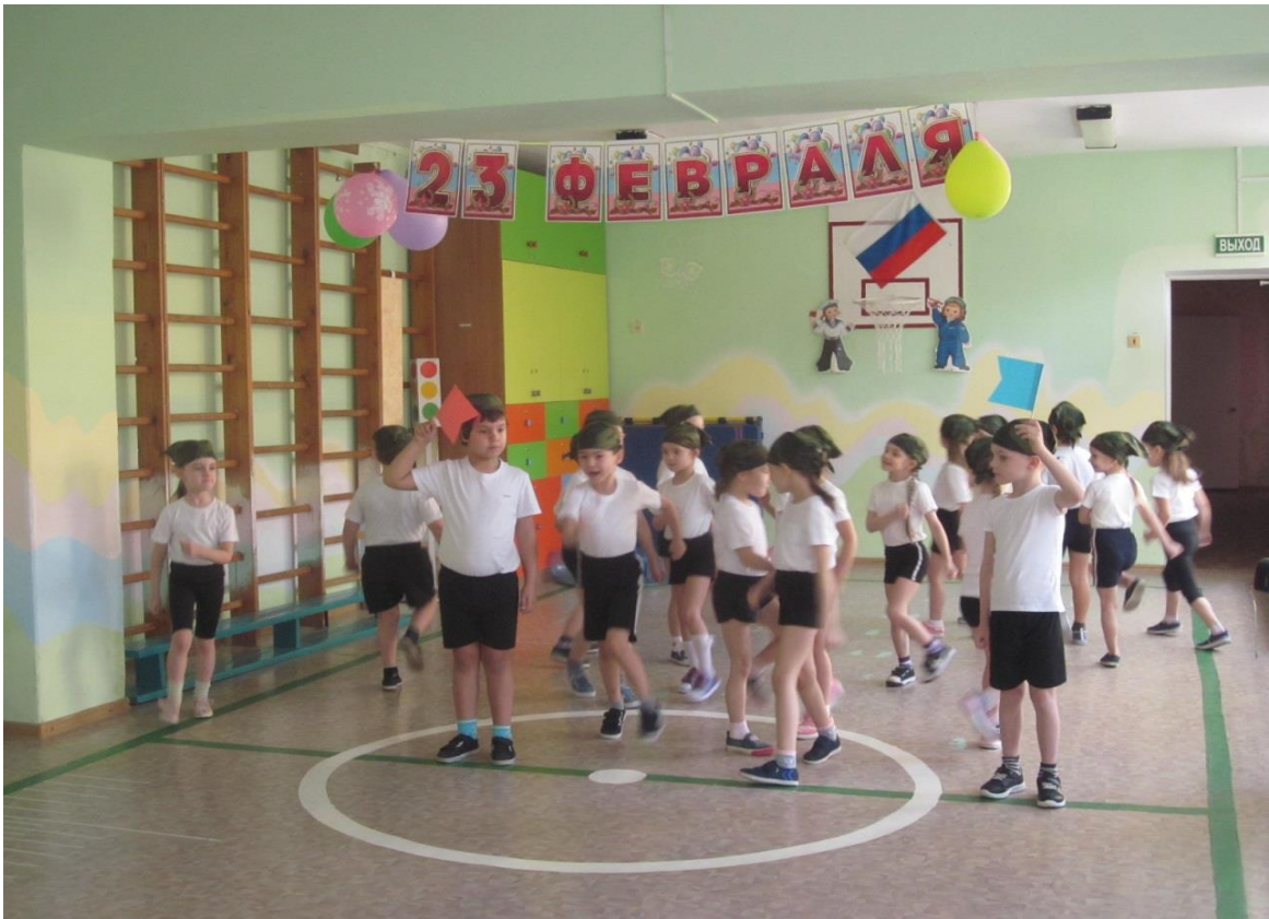
Разминка «Чья команда соберется быстрее»