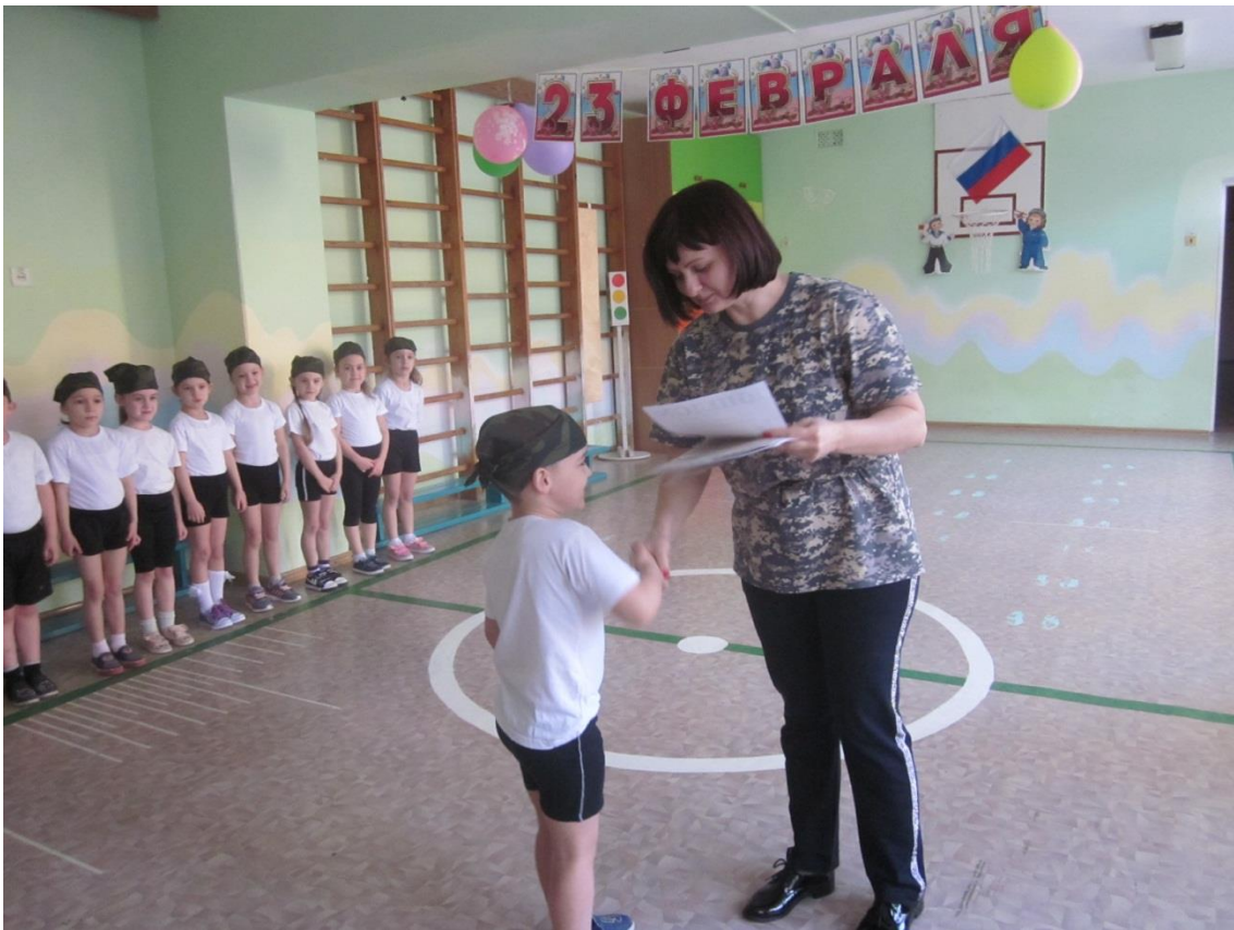
Торжественное вручение дипломов.