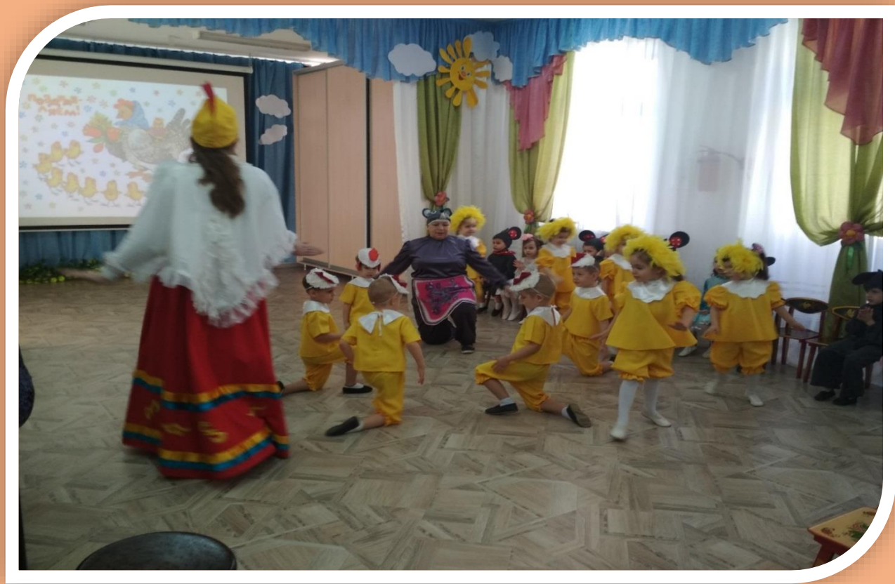
Прибежали к маме курочки –дочки и сыночки.