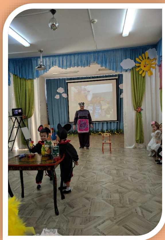
Мы послушные мышата. Любим хвостиком махать.