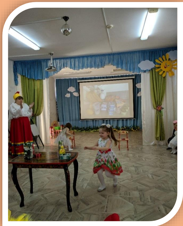
Игра «Мамины помощники»