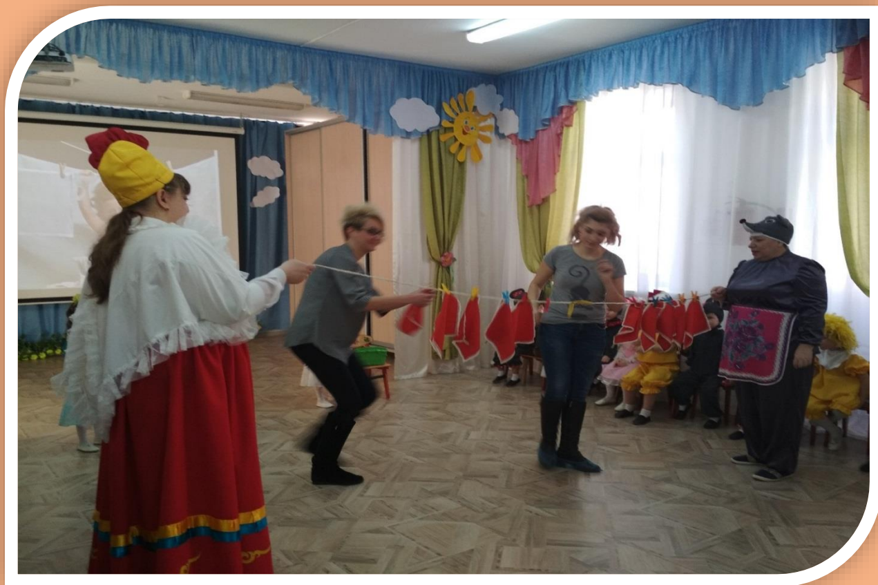
Игра «Развесь платочки».