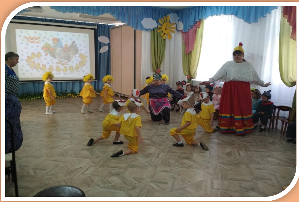
Наши гости-мама Курочка и мама Мышка.