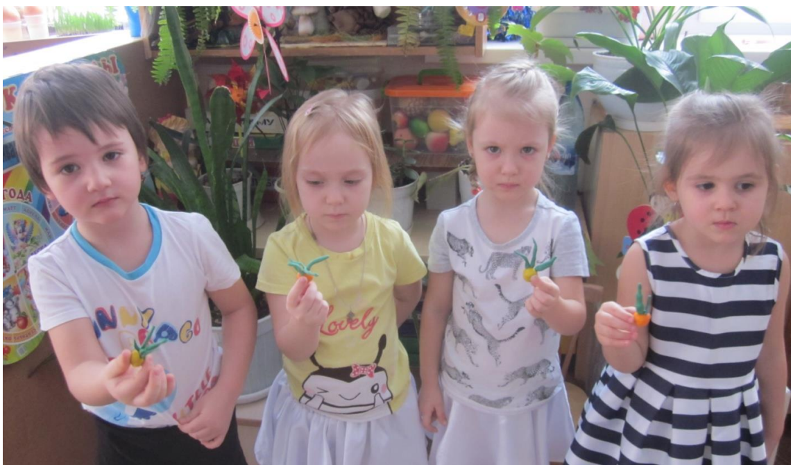
«Наш лучок мы очень любим, лепим, клеим и рисуем»

Ухаживали за растениями, поливали, свои наблюдения отображали в своих рисунках, в лепке, в аппликации. Подбирали стихи, загадки о луке и других овощах.