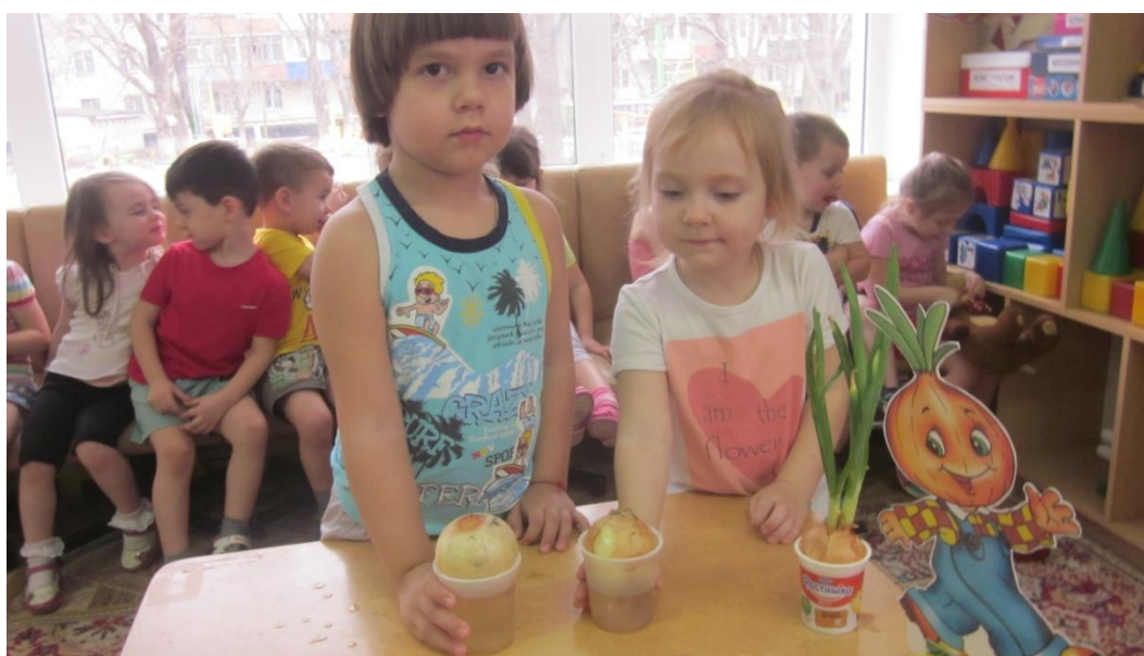
В банку мы воды налили, и лучок тут посадили.