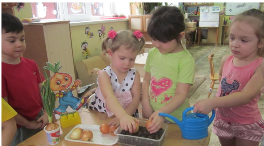
Посадили лук зелёный, чтобы вырос он огромный.

Мы во второй младшей группе «Звёздочки», разработали познавательный – исследовательский проект под названием «В гостях у Чиполино». По нашему мнению, обустройство огорода на подоконнике является познавательным и интересным занятием для детей, когда очень хочется полюбоваться первой зеленью овощей. Над этим проектом мы с детьми работали целый месяц. Дети приносили лук, чеснок, семена овощей. Большое содействие в этом нам оказывали активные родители и бабушки. С посадкой лука мы проводили много различных опытов: сажали его не только в почву, но и в холодную, и в тёплую воду.