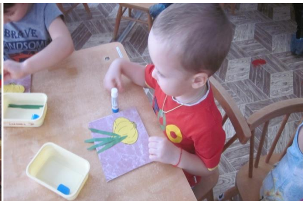
«Вот какой лучок получился у меня»