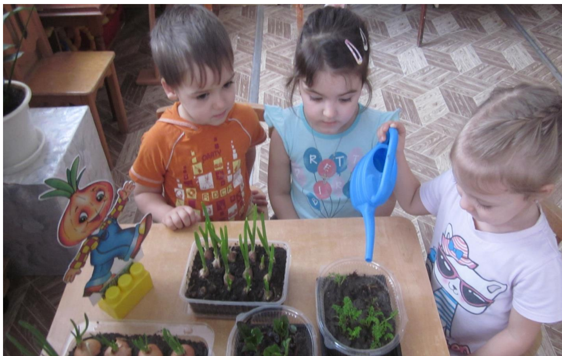
Поливали мы лучок, с золотистым он бочком.

Посеяв семена, мы наблюдали за тем, на какой день появились всходы, когда они взошли полностью.