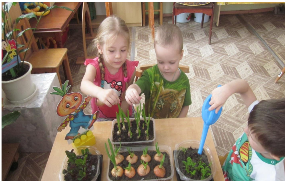
Вверх зелёная стрела, прямо в луке проросла.