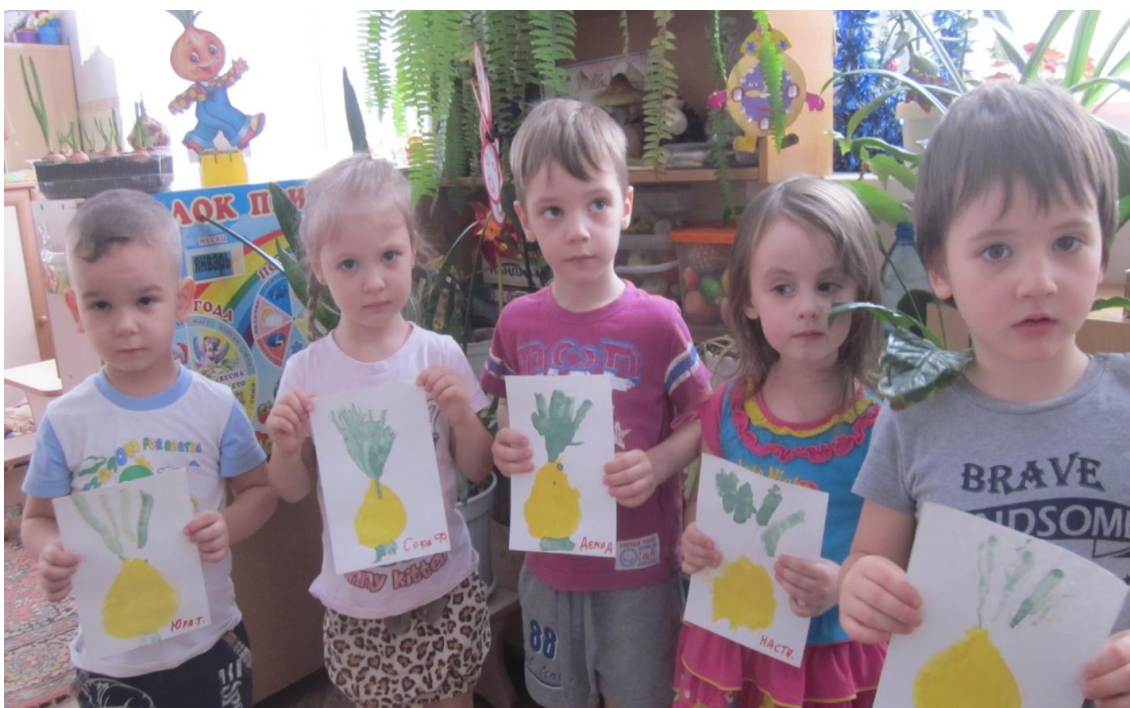
«Лучок золотой бочок»