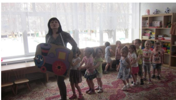
«Паровоз ребят повёз»

Ребята, на весёлом поровозике из Ромашкова, приехали на огород, отгадали загадки об овощах. Рассказали стихи, загадали загадки про лук. Но тут появляется девочка – Луковичка и говорит: «Почему же меня здесь нет в огороде?» И ребята соглашаются помочь Луковичке, сделать ей друзей и посадить на грядку. Ребята старались, увлечённо делали лучок и посадили на грядку.