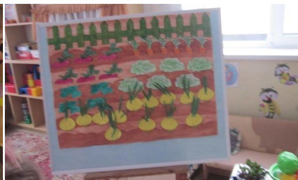
«Вырос зелёный лучок»