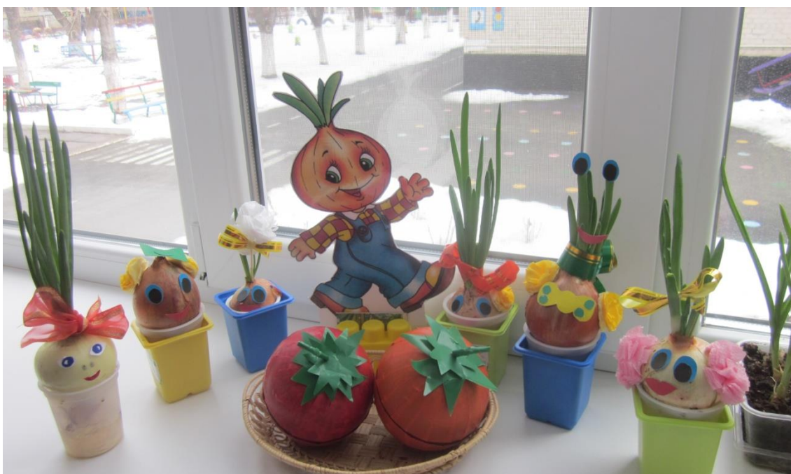
« Родители постарались»