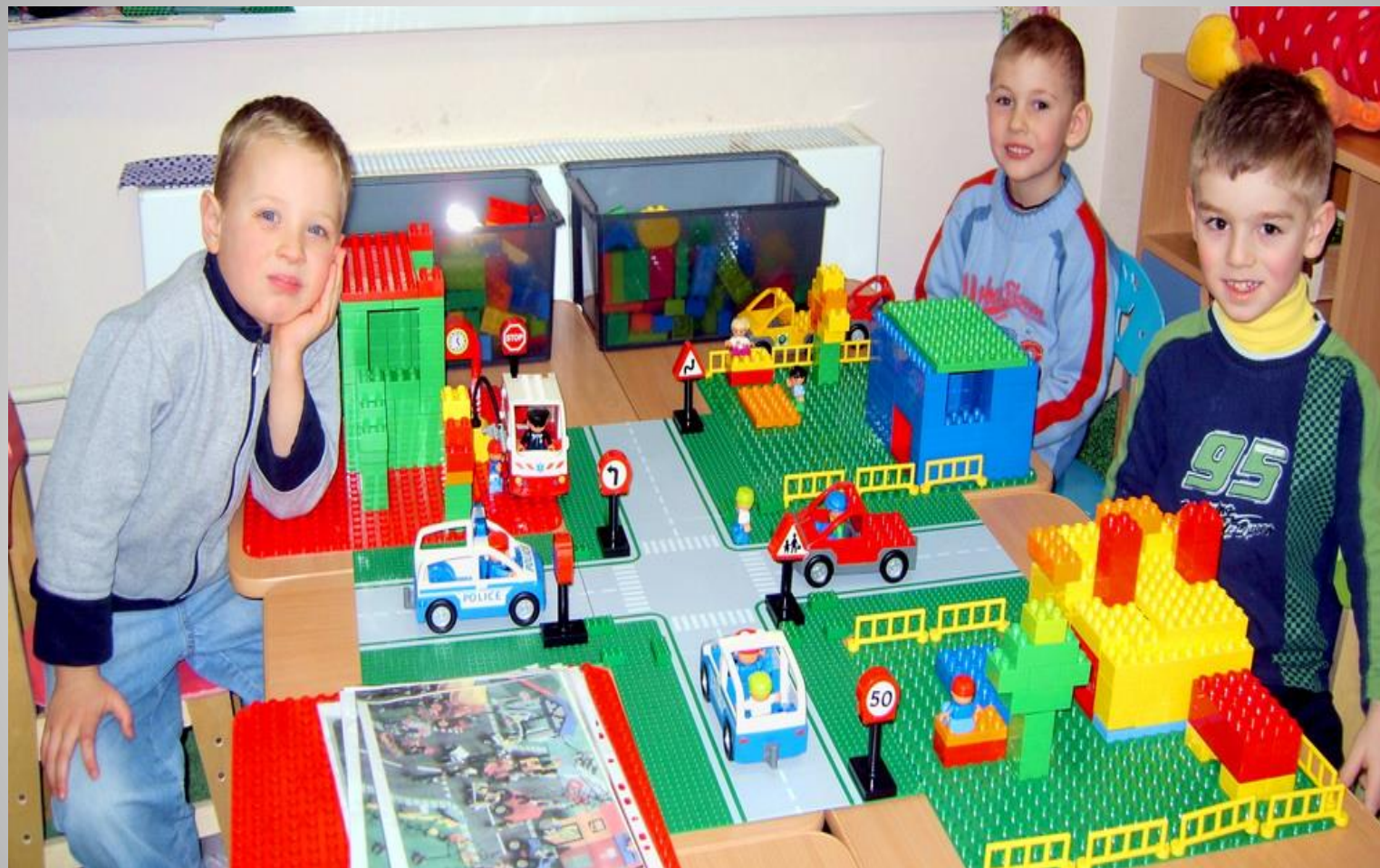
Третья часть - обыгрывание построек.