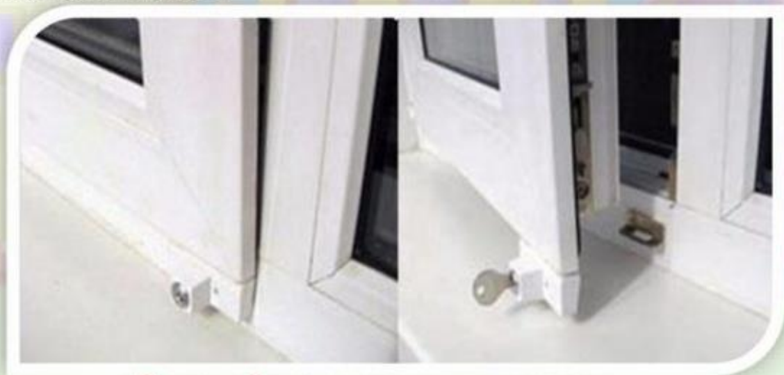
Замок блокировщик с ключом

Можно воспользоваться специальными замками блокираторами, которые предлагают установщики пластиковых окон.