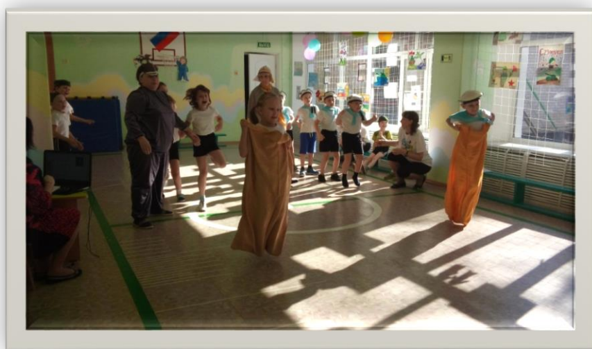
Музыкальная игра «Меч кладенец»